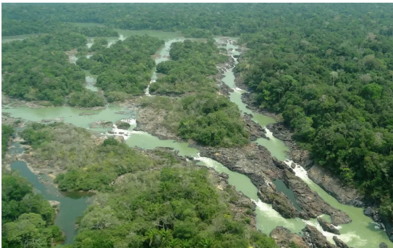
Floresta nacional do Jamanxim – Foto: Reprodução

Moraes afirmou que as salvaguardas já estavam presentes na base do voto.