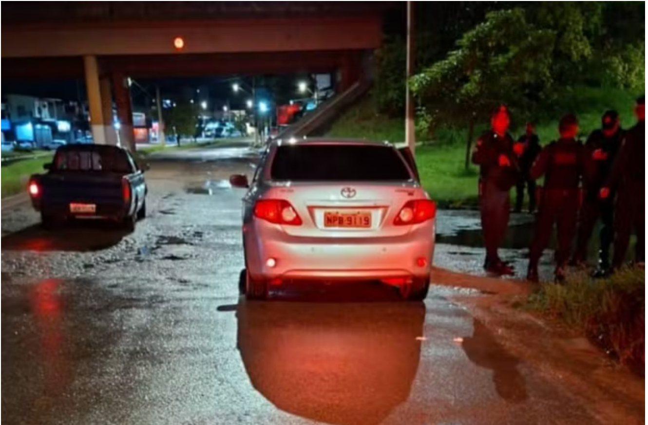
Carro onde mulher foi encontrada morta próximo ao viaduto de Santarém