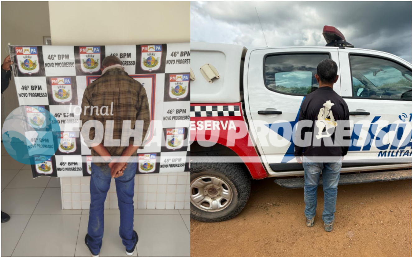
SUSPEITOS DE SAQUEAR JOIAS DE VÍTIMAS DE TRIPLO HOMICÍDIO NA BR-163