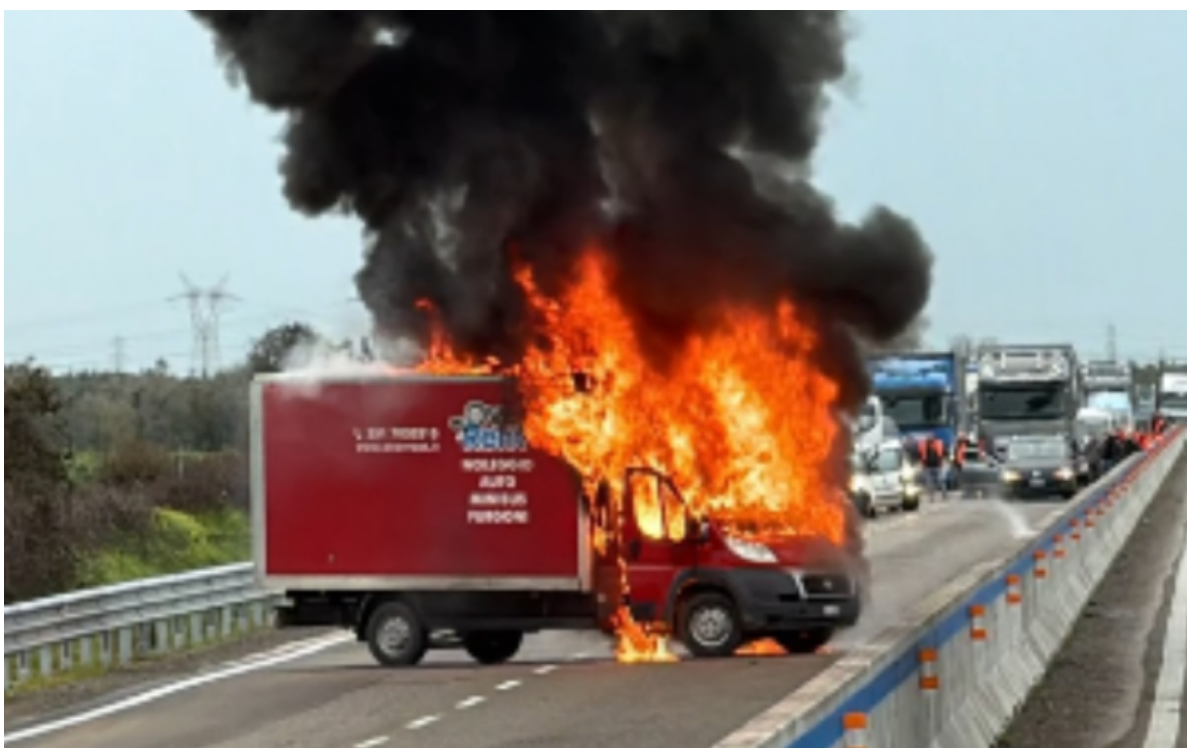
Caminhão incendiado no assalto a carro-forte na Itália