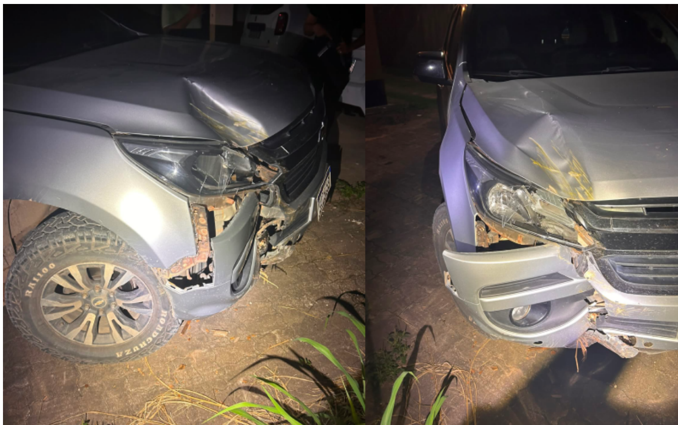
Fonte: Jornal Folha do Progresso e Publicado Por: Jornal Folha do Progresso 22/06/2026/09:11:38