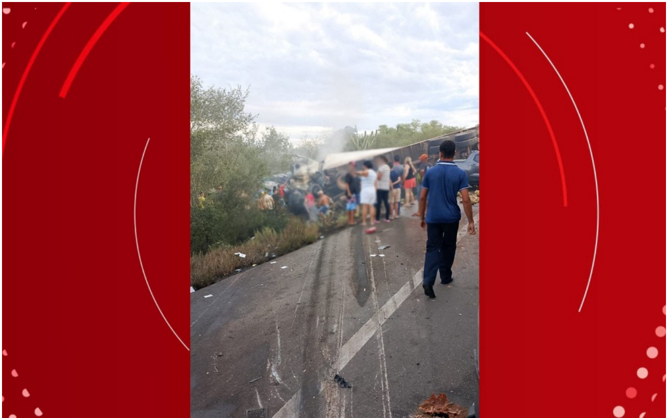
Colisão entre van e caminhão deixa mortos na BR-116, na Bahia