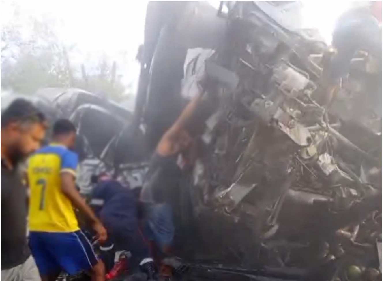
Batida entre van e caminhão ocorreu em trecho de Santa Terezinha, na Bahia