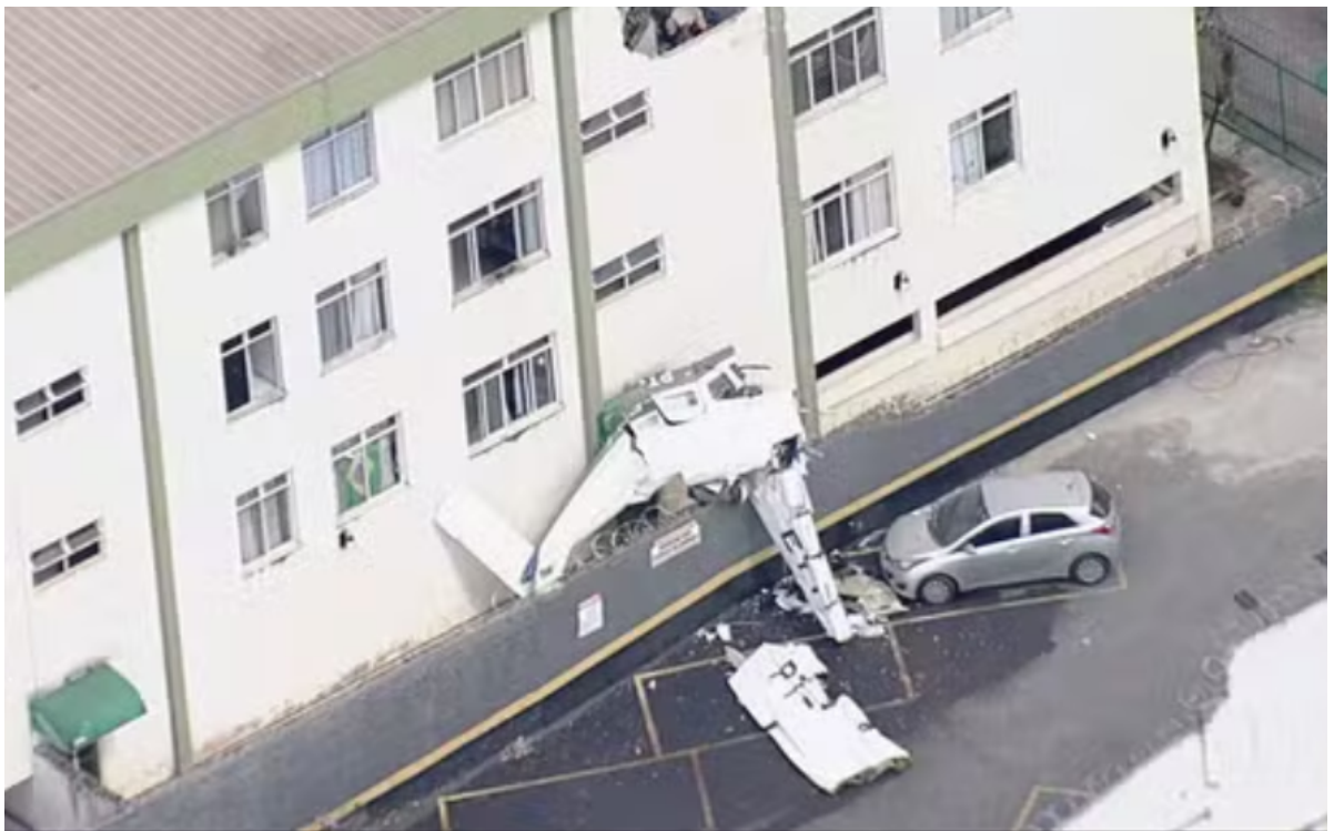
■ Avião caiu em prédio em Belo Horizonte.