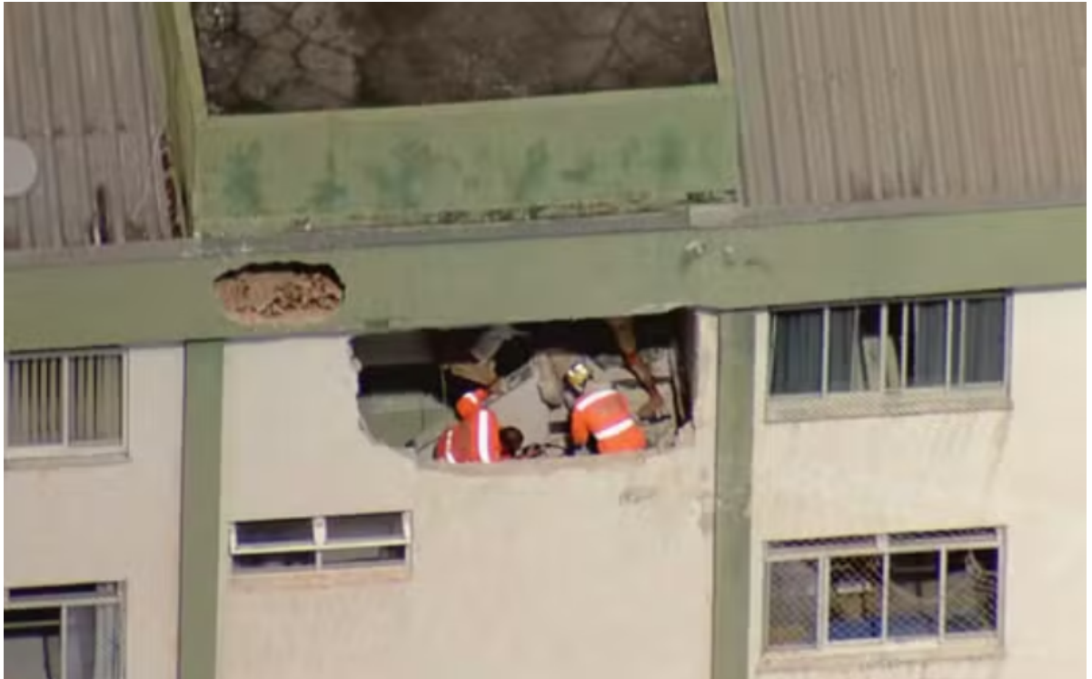
■ Parede de prédio ficou destruída após acidente. – Foto: Globocop