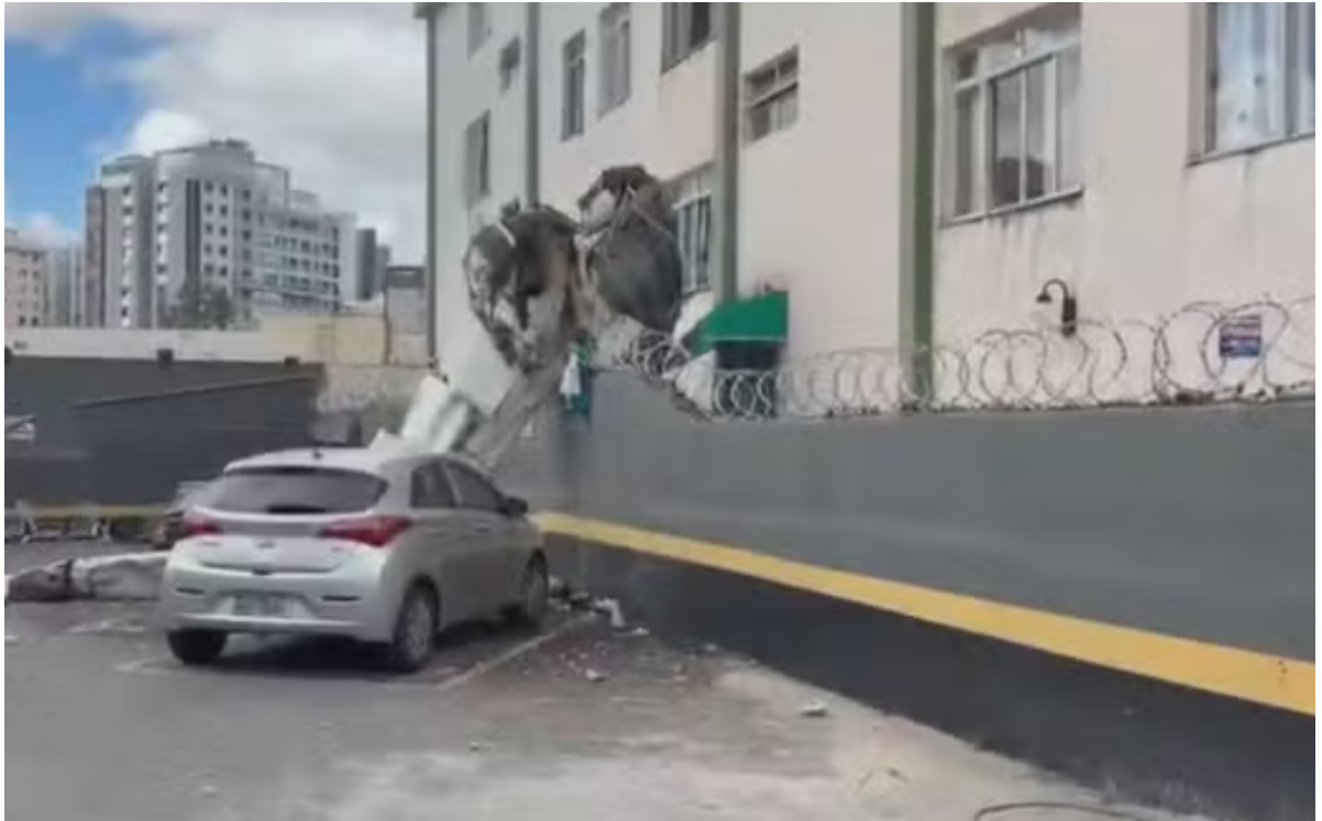
Queda de avião aconteceu no bairro Silveira, Região Nordeste de Belo Horizonte.